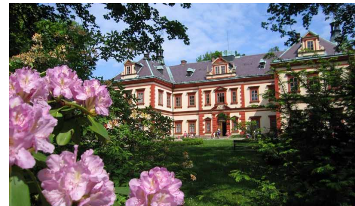
■ Chloubov Jilemnice je tamní renesanční zámek