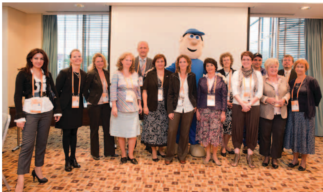
► Vedoucí jednotlivých EEN misí, autorka článku stojí uprostřed s levou rukou maskota na rameni