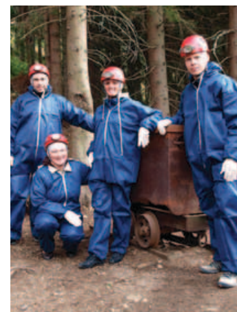
➤ Pracovníci JTS CZ-PL v hornickém dolu Kovárna