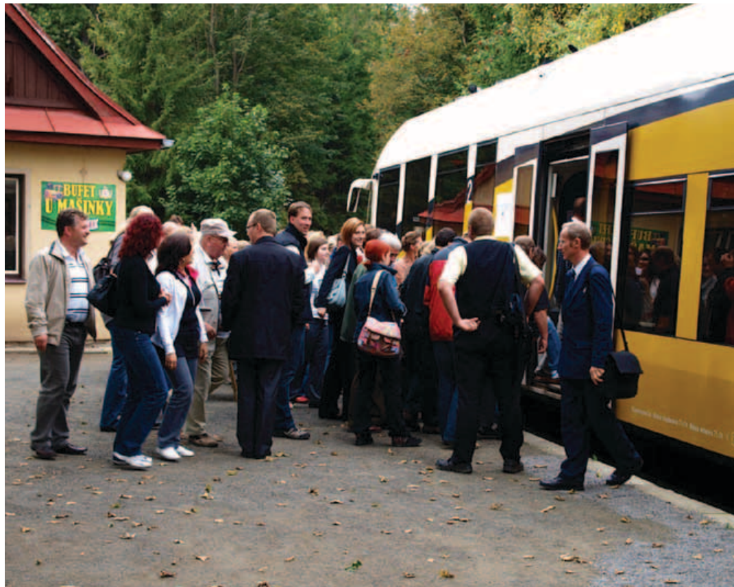
➤ Účastníci výroční akce nastupují na harrachovském nádraží do vlaku směr Polsko

V rámci výroční akce byly také představeny některé projekty realizované z tohoto programu. Jedním z hlavních bodů úterního programu byla jízda vlakem po obnovené přeshraniční trati z Harrachova do Szklarske Poreby. Provoz na této trati byl obnoven před rokem, každý den mezi oběma městy jedou čtyři páry vlaků, některé jedou na české straně až do Kořenova a na polské straně až do města Jelenia Góra.