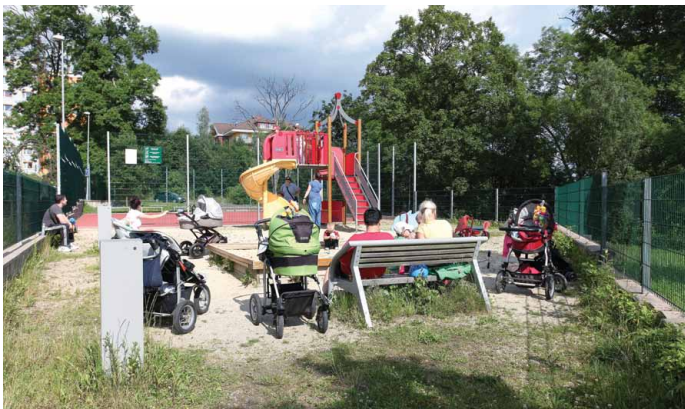
Mezi šesti zpracovanými Integrovanými plány rozvoje území je i liberecko-jablonecká aglomerace. Obě města již mají zkušenost s realizací IPRM, jak ukazuje snímek z libereckého sídliště Rochlice

CRR se na administraci včas připravilo a sestavilo speciální šestičlenný tým na pobočce Praha, který byl určen pouze na tuto výzvu. Současně byl metodicky ošetřen účinný mechanismus administrace a komunikace s příjemci. Naši prioritou bylo příjemcům maximálně ulehčit administraci projektů a zajistit co nejlhůdší průběh výzvy. Byl zpracován, zveřejněn a pravidelně aktualizován přehled často kladených dotazů. I přes značné množství jednotlivých příjemců se podařilo udržet se všemi aktivní kontakt a jednotliví pracovníci znají své příjemce. Zároveň ale byla zajištěna plnohodnotná zastupitelnost jednotlivých administrátorů na straně CRR. Také jsme příjemcům připravili podrobný metodický návod, jak vyplnit závěrečnou monitorovací zprávu, aby se předložilo vracení dokladů a urychlila se administrace. Přesto její průběh úplně bezproblémový nebyl. V rámci přípravy na očekávané předložení 178