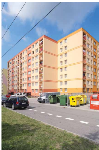
▣ Revitalizace sídliště v Havířově (autor: Ing. Jiří Šlemar)