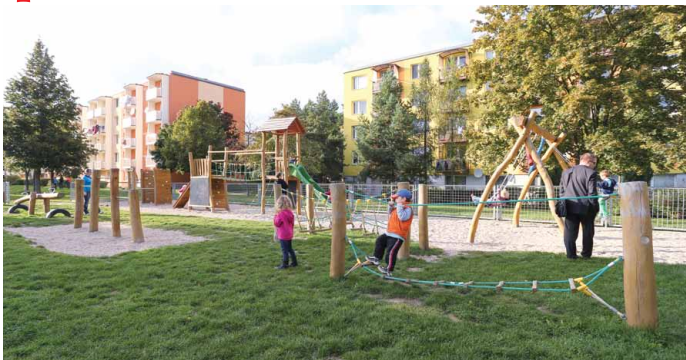
■ Opravené domy a nové dětské hřiště v Třebíči

Prvním významným krokem na cestě ke skutečné regionální politice bylo založení Ministerstva pro místní rozvoj v roce 1996 a jeho příspěvkové organizace Centra pro regionální rozvoj o rok později. V roce 1998 vláda přijala aktualizaci Zásad regionální politiky, které poprvé hovoří o nutnosti koncepční činnosti státu