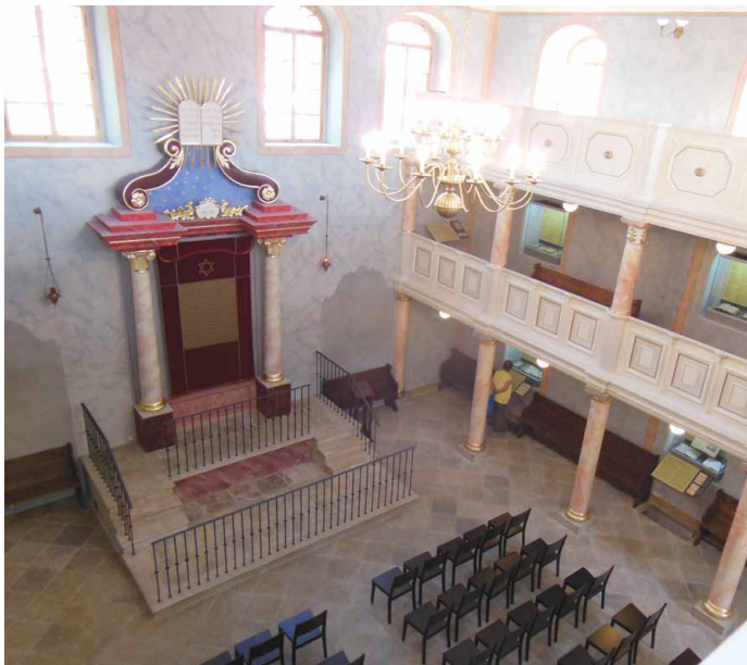
▣ Součástí projektu 10 hvězd byla i rekonstrukce brandýské synagogy a svatostánku aron ha-kodes (autor: Ing. Adéla Brožová)

Ke svému konci se blíží i projekt Národní centrum zahradní kultury v Kroměříži. Ten se skládá z úprav interiérů a vstupní expozice Arcibiskupského zámku, z rekonstrukce zahradnictví Podzámecké zahrady jako technického zázemí pro údržbu a z obnovy Květné zahrady. Výsledky projektu jsou zacíleny hned čtyřmi směry. Prvním směrem je tvorba metodik a poradenství pro majitele a správce historických za-