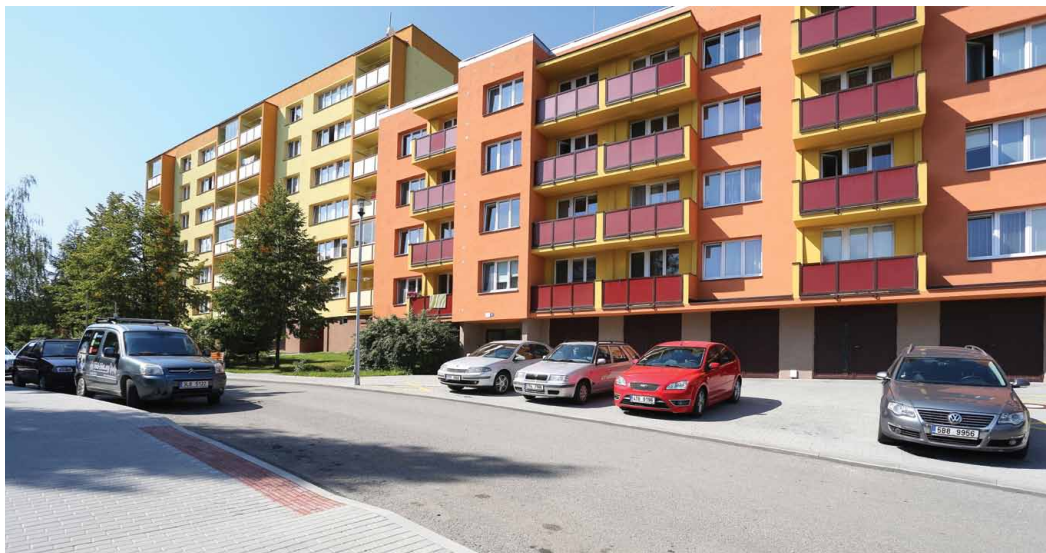
■ Mezi městy realizujícími IPRM byl také Nový Jičín (autor: Ing. Jiří Šlemar)

mezit vzniku takzvaných sociálních ghatt na sídlišťích s vyšší koncentrací těchto skupin. IPRM jsou rozděleny do tří dílčích aktivit. Projekty na revitalizaci veřejných prostranství zahrnují výsadbu a obnovu veřejné zeleně, obnovu městského mobiliáře, výstavbu a rekonstrukci chodníků a cyklistických stezek, realizaci technické infrastruktury nebo budování rekreačních ploch a dětských hřišť. Oprávněnými žadateli pro tyto projekty jsou pouze města, která mohou získat z evropských fondů podporu ve výši 85 procent nákladů projektu. Projekty na regeneraci bytových domů zahrnují zateplení domů, opravy nosných konstrukcí, sanaci základů, rekonstrukci technického vybavení domů, modernizaci lodžii a balkonů a zajištění moderního sociálního bydlení při renovacích stávajících budov. Dotace byla určena pro vlastníky bytových domů – města, bytová družstva, společenství vlastníků jednotek a další majitele z řad právnických i fyzických osob. Výše dotace byla