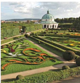
■ Jedním z hlavních turistických cílů střední Moravy je kroměřížský zámek a přilehlé zahrady, zapsané na seznamu památek UNESCO (autor: Stanislav Pecháček)

Nestátní subjekty se mohou o dotaci ucházet výhradně v aktivitě